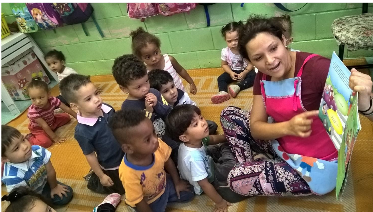
Transformação de espaço