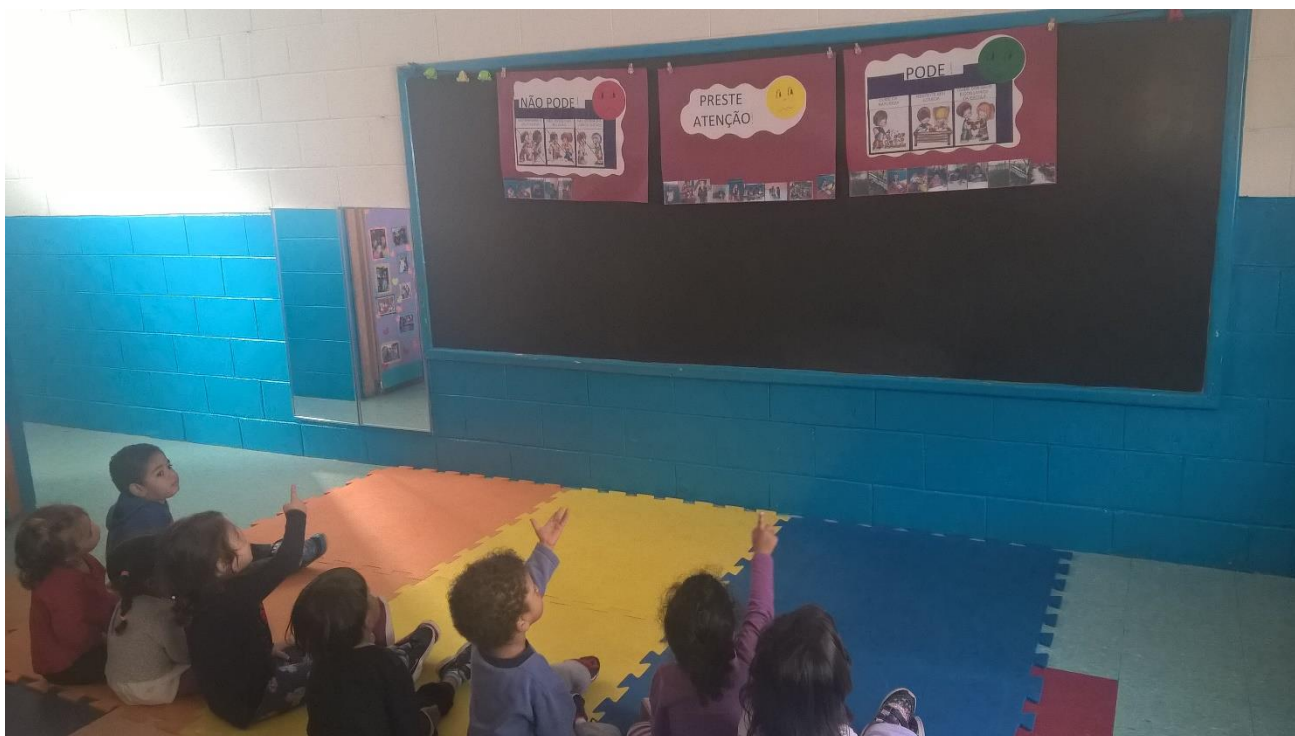
Roda de leitura