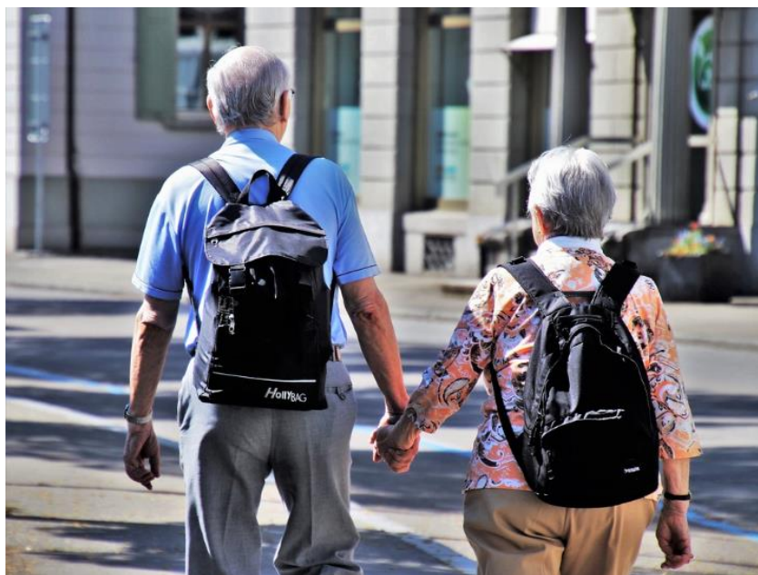
Figura 1 – Ilustração sobre a discussão de mobilidade aliada a uma população com maior expectativa de vida.

A arquitetura das cidades precisa ser pensada não apenas com as adaptações visíveis previstas em lei, mas com as novas necessidades da população, que precisa e merece envelhecer com qualidade de vida.